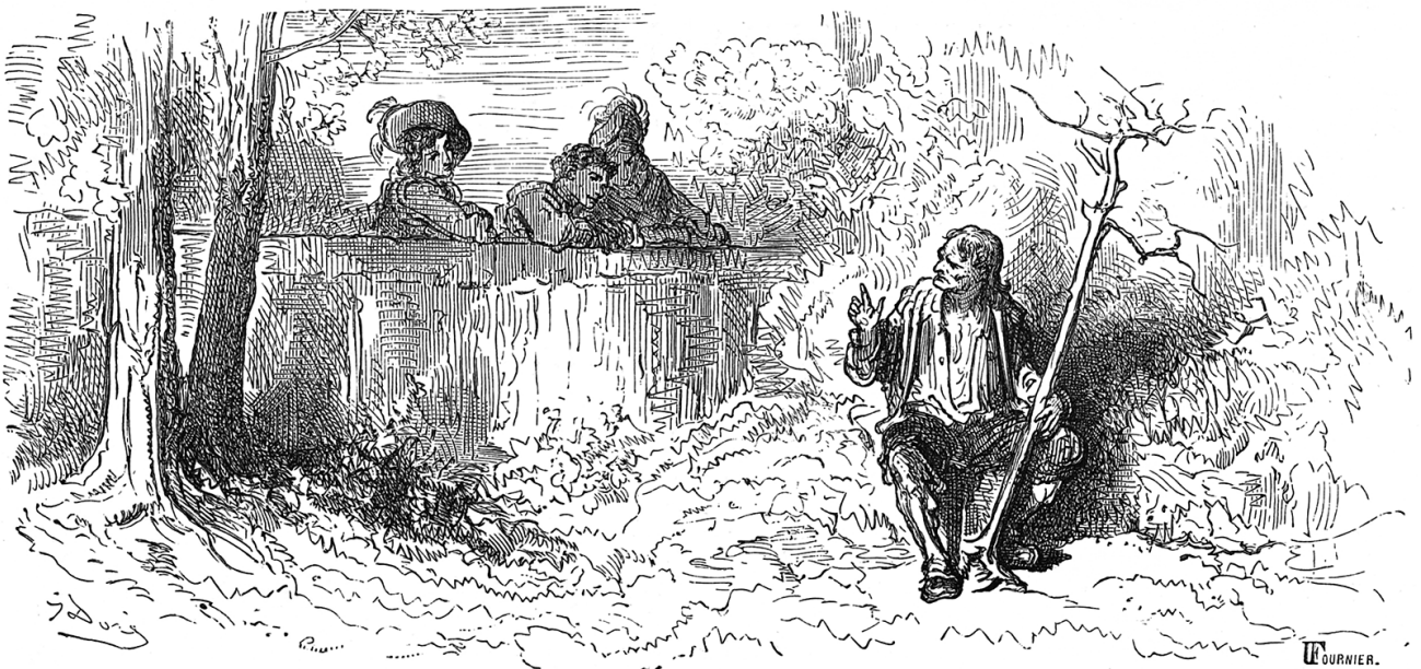
illustration de Gustave Doré (1832–1883)