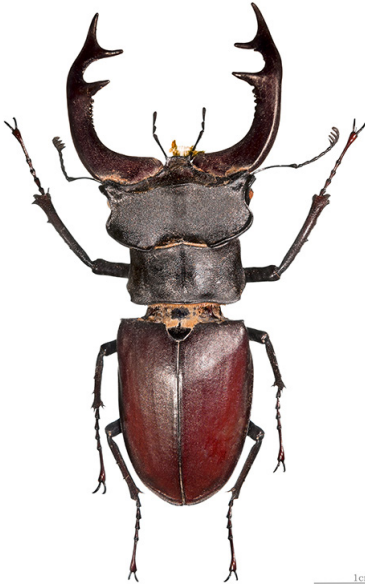
Lucane mâle

Nous avons fait remonter l'information chez RESA qui a fait appel à la Brigade anti-tag de la Ville de Liège. Celle-ci est intervenue dans les 48 heures. Merci et bravo pour cette belle réactivité.